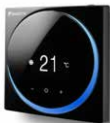
Noir RAL 9005 (mat) BRC1HHDK