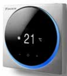
Argent RAL 9006 (métallique) BRC1HHDS