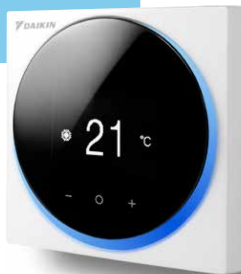
Blanc RAL9003 (brillant) BRC1HHDW

Télécommande câblée conviviale au design haut de gamme