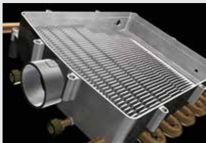
ROTEX Smart Condens con aletas rectas