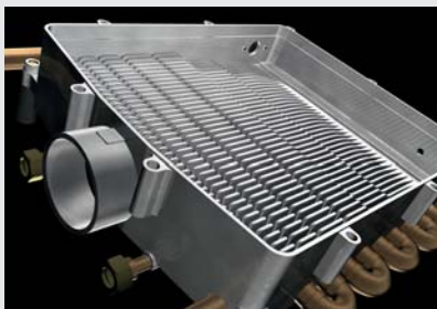
ROTEX GW-20 Gerade Lamellen