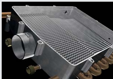
ROTEX GW-30 Labyrinth Lamellen