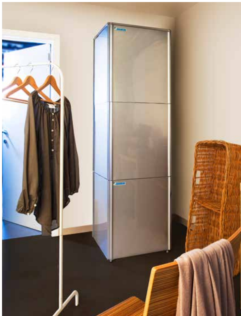
Vnútornú jednotku a zásobník na teplú pitnú vodu je možné umiestniť na seba

* COP (Koefficient účinnosti) až do 3,08 EW: 55°C; LW 65°C, Dt 10°C; 7°CDB/6°CWB