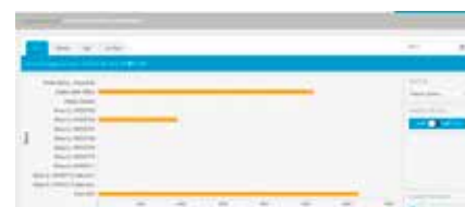
3. Porovnání spotřeby energie ve více místech