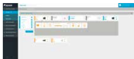
1. Monitorování a regulace vašeho systému