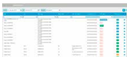
5. Přijetí opatření na základě alarmů a predikce poruch