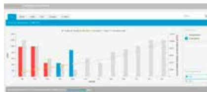
2. Vergelijk het energieverbruik met de doelstelling