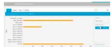
3. Vergelijk het energieverbruik van verschillende locaties