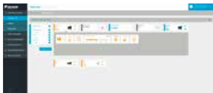
1. Bewaak en bedien uw systeem