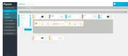
1. Surveillez et commandez votre système