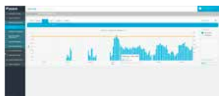
4. Effectuez le suivi détaillé de la consommation d'énergie