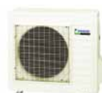
Unidade exterior RXS50J