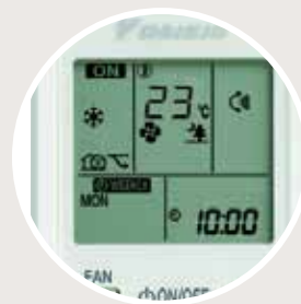
Controlo remoto por infravermelhos (de série) ARC452A1