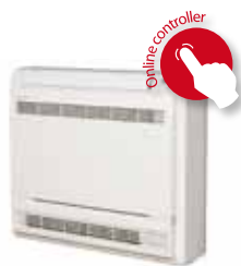
Unidade interior FVXS25,35,50F

(1) Etiqueta energética: uma escala de A (mais eficiente) a G (menos eficiente) (2) Consumo anual de energia: com base numa utilização média de 500 horas de funcionamento por ano sob carga máxima (condições nominais) (3) Arrefecimento: temp. interior 27°C; 19,0°C; temp. exterior 35°C; comprimento equivalente da tubagem: 5m, diferença de nível: 0m (4) Aquecimento: temp. interior 20°C; temp. exterior 7°C; 6°C; tubagem de refrigerante equivalente: 5m; diferença de nível: 0m