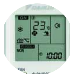
Infrarood-afstandsbediening (standaard) ARC452A1