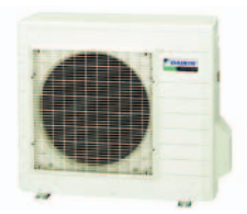
Udendørs enhed RXS50J