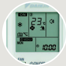
Trådløs fjernbetjening (standard) ARC452A1