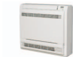
Indendørs enhed FVXS25,35,50F