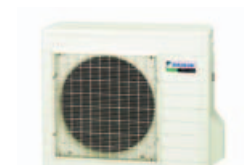
Udendørs enhed RXS35G