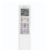
Trådløs fjernbetjening ARC452A3