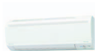
Indendørs enhed FTXS20,25,35,42,50J