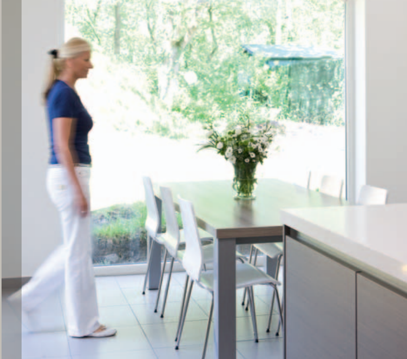
Trådløs fjernbetjening (standard) ARC4523